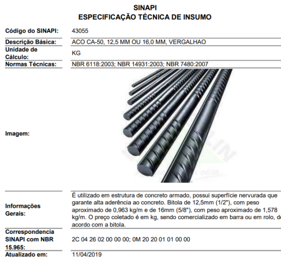
Figura 1 – Exemplo de Ficha Técnica de Insumo com a Classificação da Informação